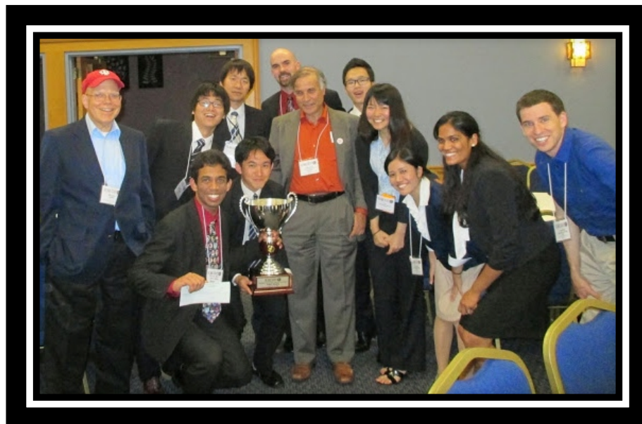
表彰式後の大会主催者との写真